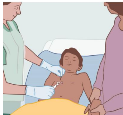
Venporten sitter oftast på bröstkorgen.