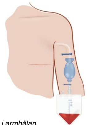
Dränage i armhålan

Dränaget kan göra att du känner stickningar i såret. Tala om för vårdpersonalen om du har ont av dränaget, så får du smärtstillande medicin.